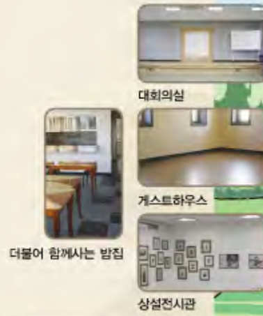
더불어 함께하는 밥집