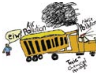
(ローマップのイラストより)

汚れているところなど、いろいろな環境問題、迷惑なことなどに使えるアイコン。なぜ、そのようなことになったのか、原因を考えてみよう。