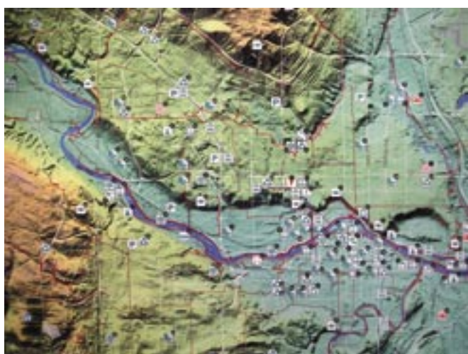
カナダ・カルガリーグリーンマップ