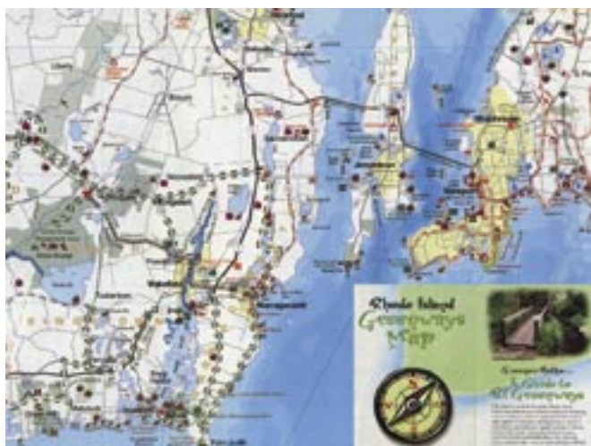
アメリカ・ロードアイランドグリーンマップ