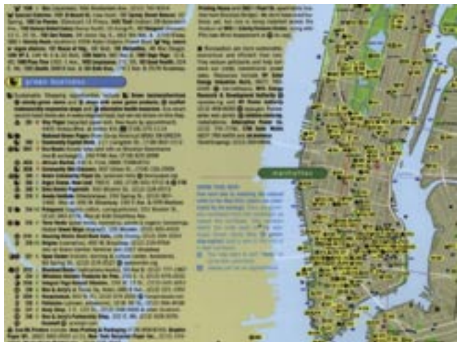
アメリカ・ニューヨークグリーンマップ