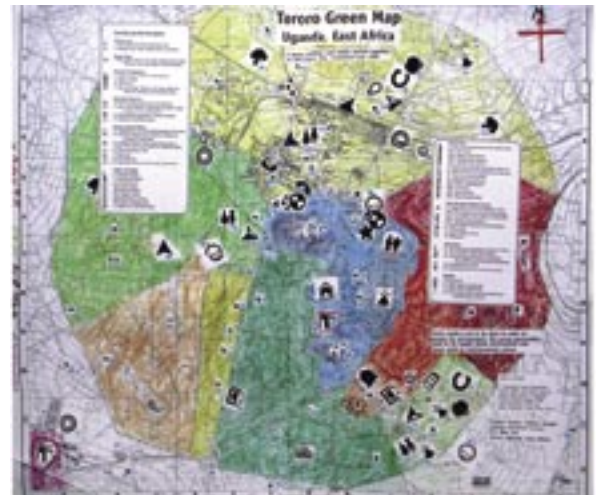
アフリカ・トロログリーンマップ