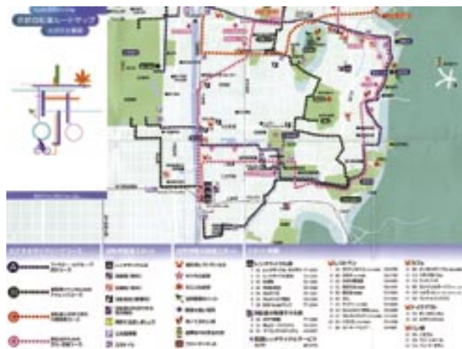
きょうとじてんしゃ 京都自転車グリーンマップ