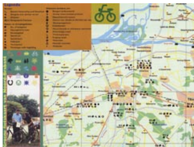
オランダ・じてんしゃ 自転車グリーンマップ