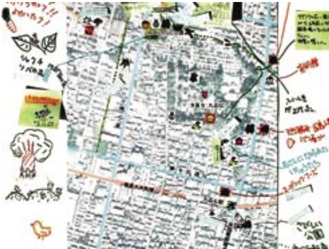
せたがやグリーンマップ・九品仏まちめぐり くほんぶつ