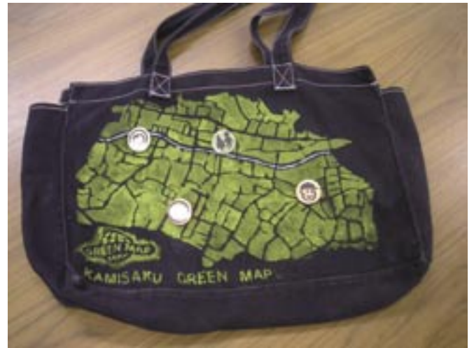
かわさき かみさくのべへん 川崎グリーンマップ・上作延編