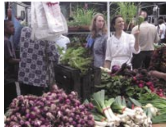
ユニオンスクエア (ニューヨークグリーンマップ)