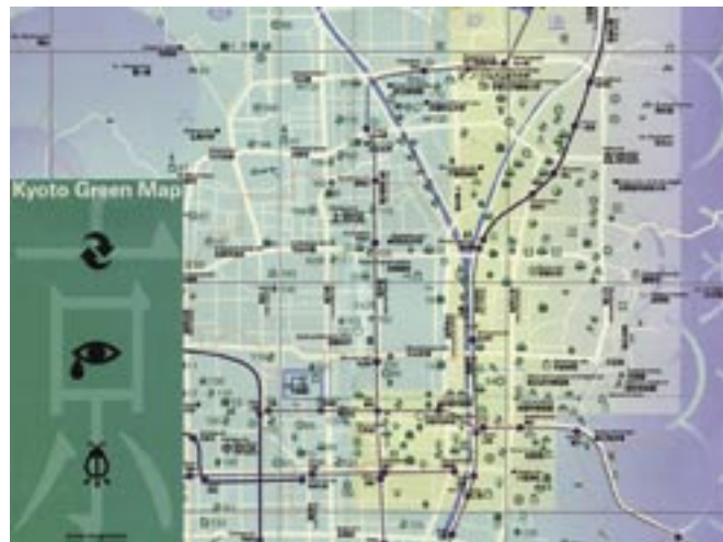
きょうと 京都グリーンマップ