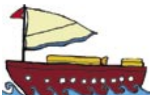
(ローマップのイラストより)

橋がないところなどでは、フェリーが主要な公共交通機関だ。ゆっくりと景色を楽しみながら移動するのも風情がある。