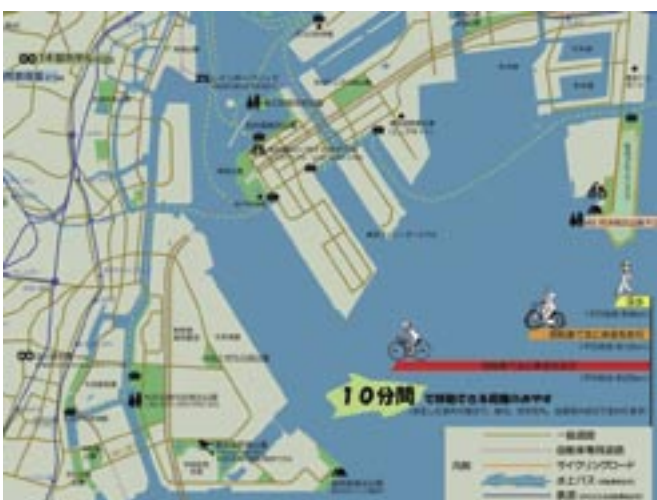
とうきょうじてんしゃ 東京自転車グリーンマップ・なごみマップ