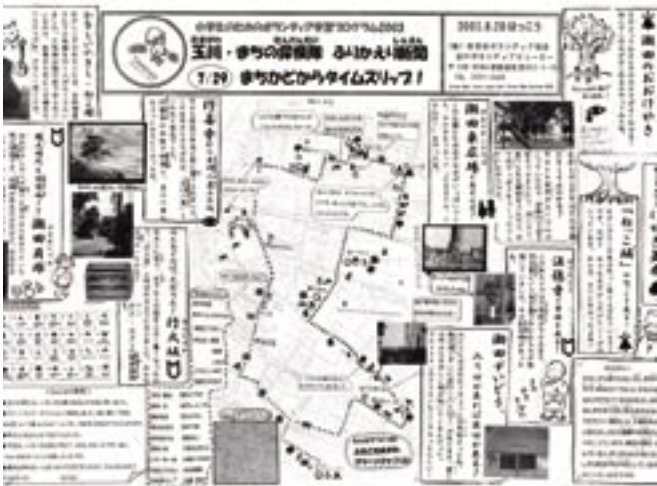
せたがやグリーンマップ・二子玉川まちめぐり ふたこたまがわ