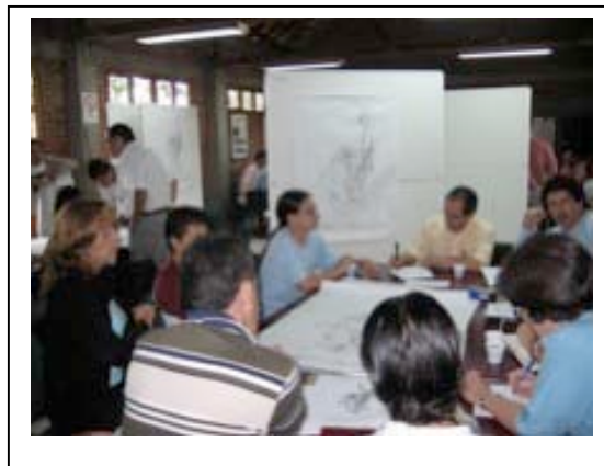
Green Map resources.