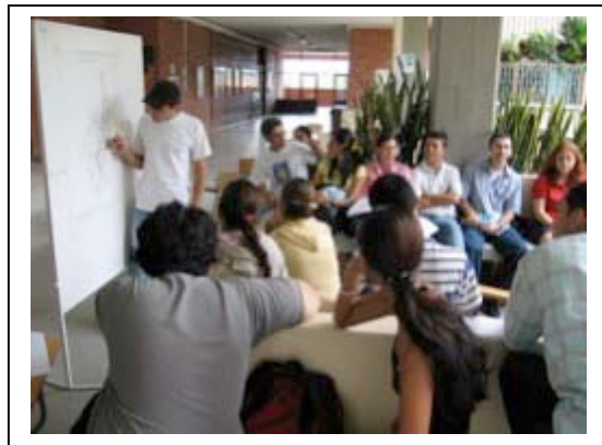
First Green Mapmaking Marathon activity. Workshop, field work, green mapping activity and public presentation.