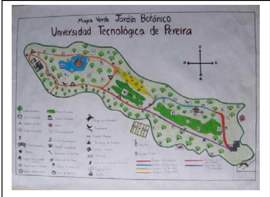
Mapas Verdes sketches resulting of a university class project made by environmental administrators students.

Then, the Urban Environmental Management Research Group decided to go one step further. It is planning to publish a printed edition Green Map, for the Research Groups National Conference. Volunteer students in different research groups of Pereira’s Environmental Sciences Faculty are in charge of this Green Map. The long-term plan is to publish it on the Internet using GIS (Geographic Information System).