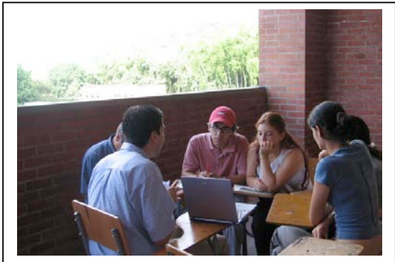
Green Map presentation to the Urban Environmental Management Research Group.

On Saturday April 8 th , 2006, more than 30 volunteers, students and special guests met at the university for South America’s First Green Mapmaking Marathon, an activity where the participants made two maps charting the "campus now " and "campus in the future" as a way to identify environmental problems and possible solutions. The outcomes of this activity became very important for the UTP Planning Office because they are elaborating upon the Land Zoning Plan for the UTP Campus and its surrounding area. Also, the UTP Planning Office adopted the same methodology "present-future assessment" in their community mapping activity as part of their ongoing community planning process of the Land Zoning Plan.